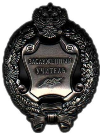
Нагрудный знак «Заслуженный учитель РФ»

Почётное звание «Заслуженный учитель Российской Федерации» присваивается, как правило, не ранее чем через 20 лет с начала преподавательской деятельности и при наличии у представленного к награде лица отраслевой награды (почётный знак, отраслевое почётное звание или медаль К. Д. Ушинского) федерального органа государственной власти или органов государственной власти субъектов Российской Федерации.